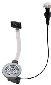
Vidange automatique 8407 100