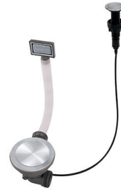
Vidange automatique Space Push - PP 8407 116