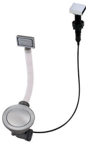
Vidange automatique Space - PA 8407 108