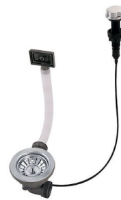
Vidange automatique 8407 000